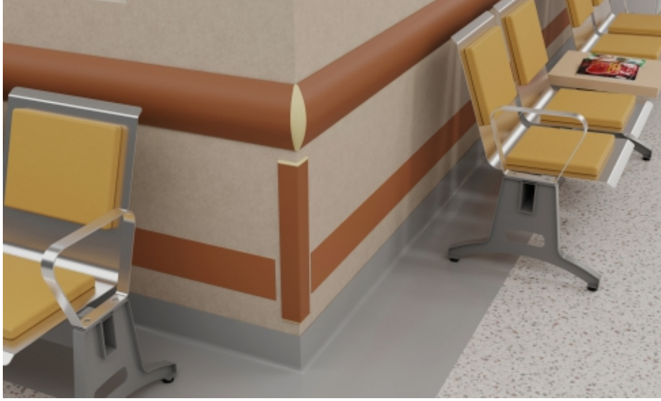
Duvar Köşeleri Wall Corners