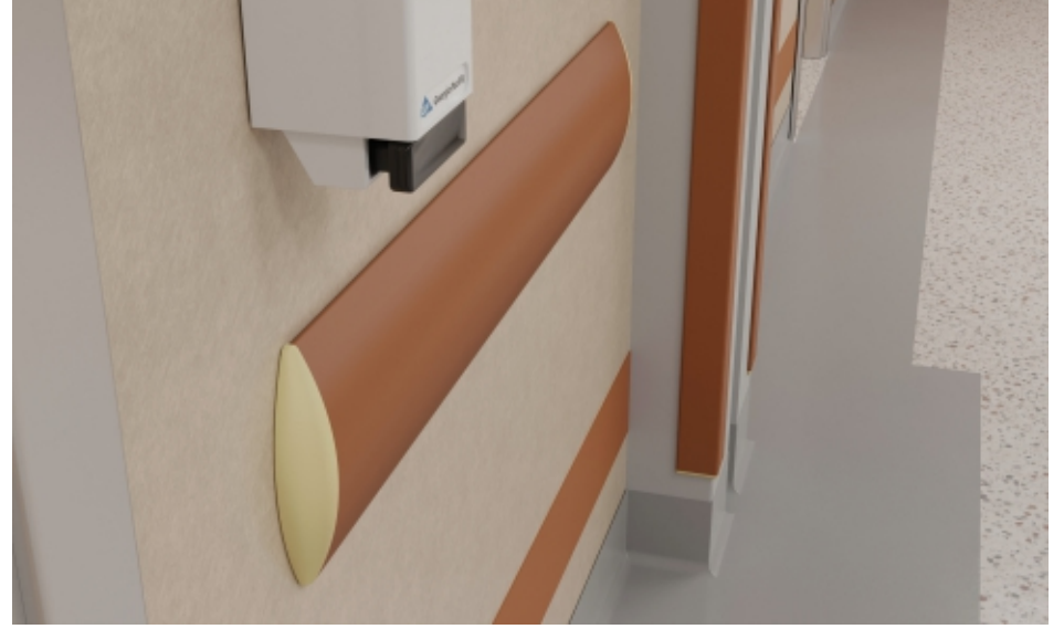
Duvar Yüzeyleri Wall Surfaces