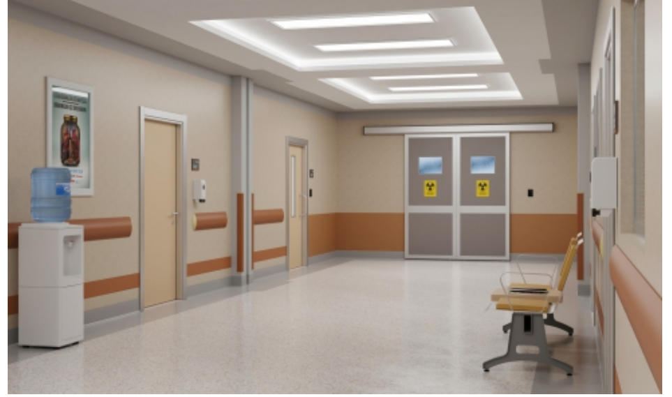
Koridorlar ve Bekleme Alanları Hallways and Waiting Areas