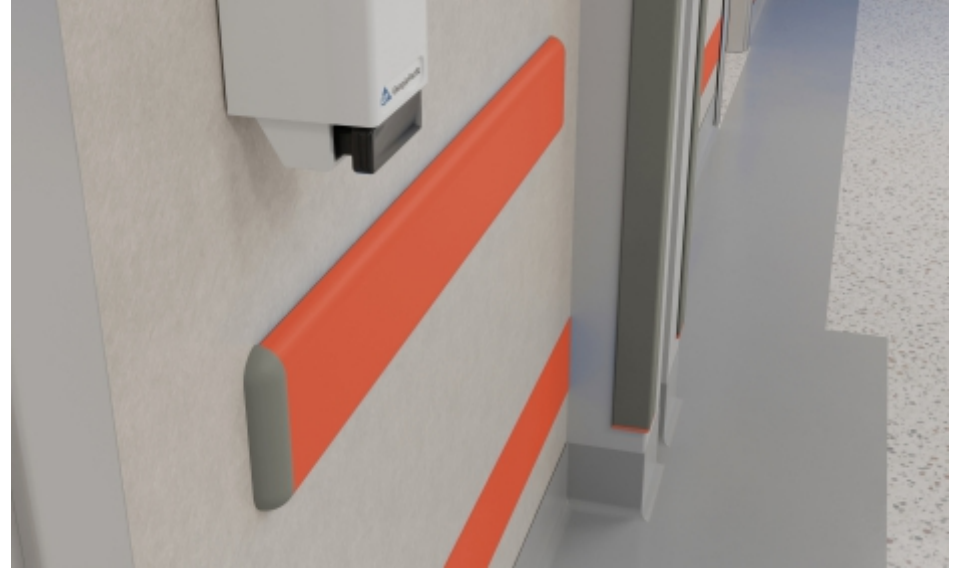
Duvar Yüzeyleri Wall Surfaces