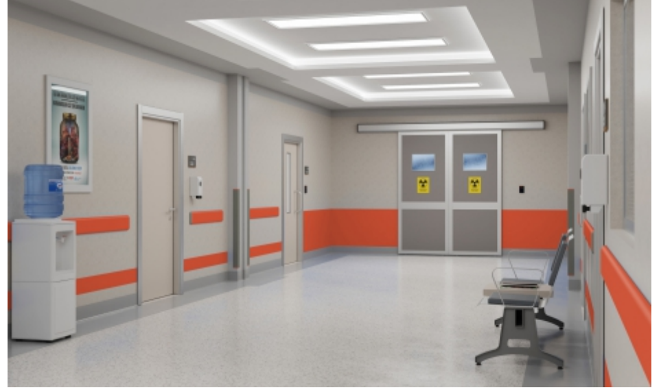
Koridorlar ve Bekleme Alanları Hallways and Waiting Areas