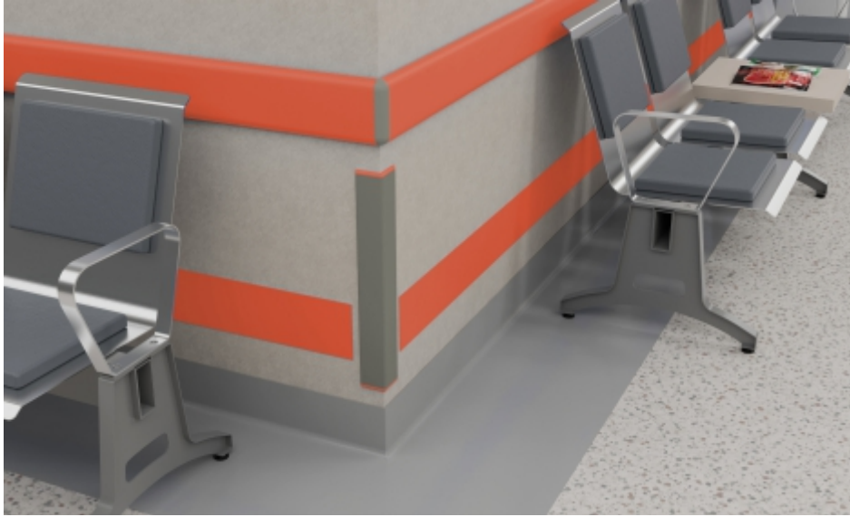
Duvar Köşeleri Wall Corners