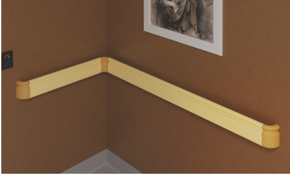
Duvar Köşeleri Wall Corners