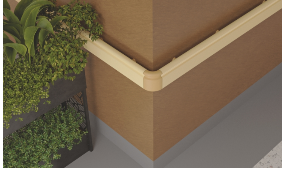
Koridorlar ve Bekleme Alanları Hallways and Waiting Areas