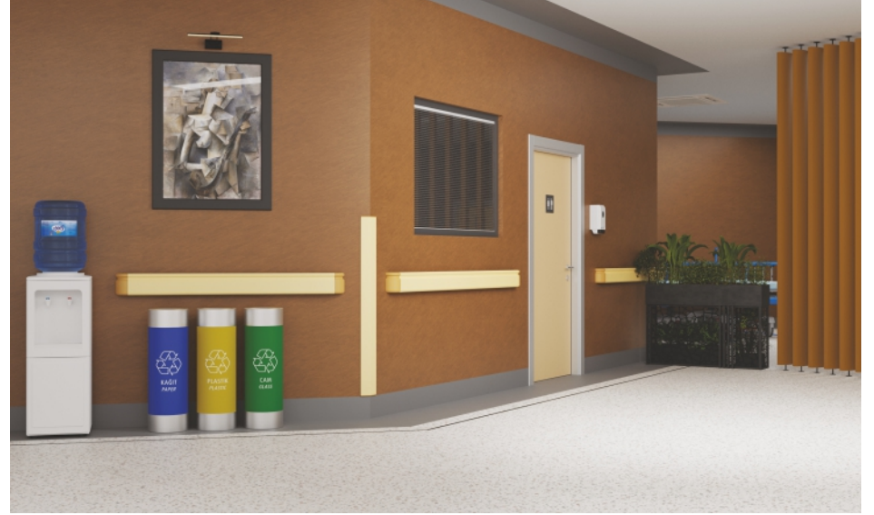
Duvar Yüzeyleri Wall Surfaces