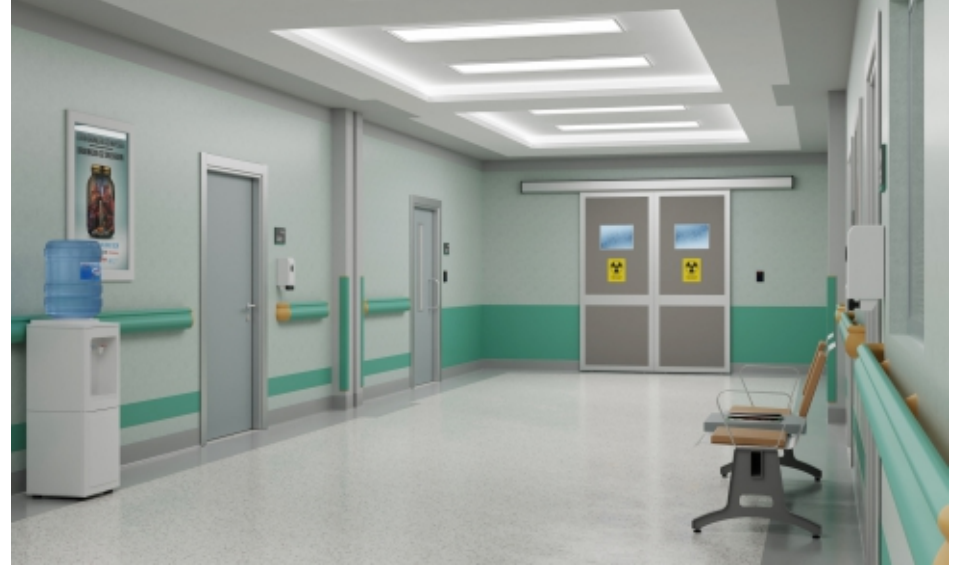
Koridorlar ve Bekleme Alanları Hallways and Waiting Areas