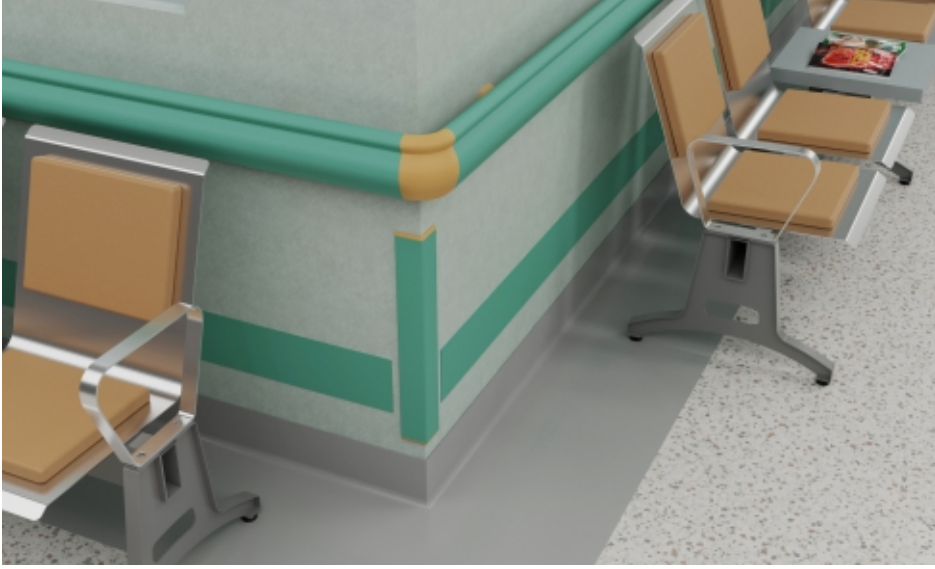
Duvar Köşeleri Wall Corners