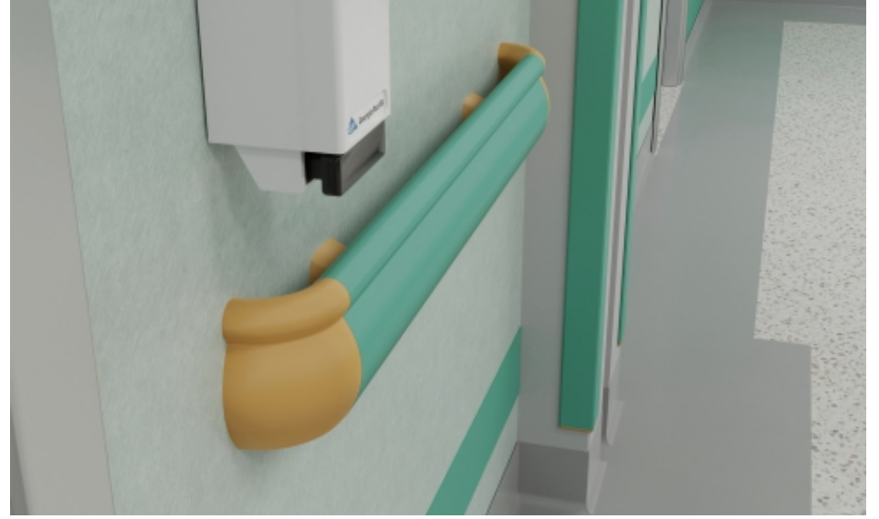
Duvar Yüzeyleri Wall Surfaces