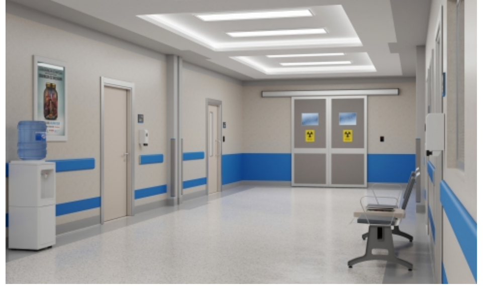
Koridorlar ve Bekleme Alanları Hallways and Waiting Areas