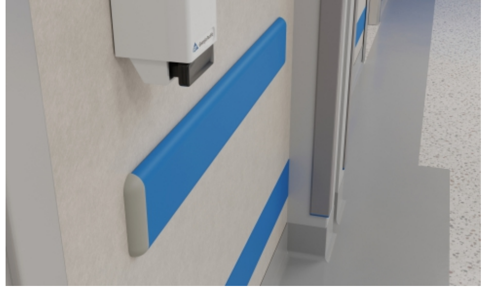
Duvar Yüzeyleri Wall Surfaces