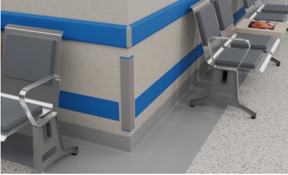
Duvar Köşeleri Wall Corners